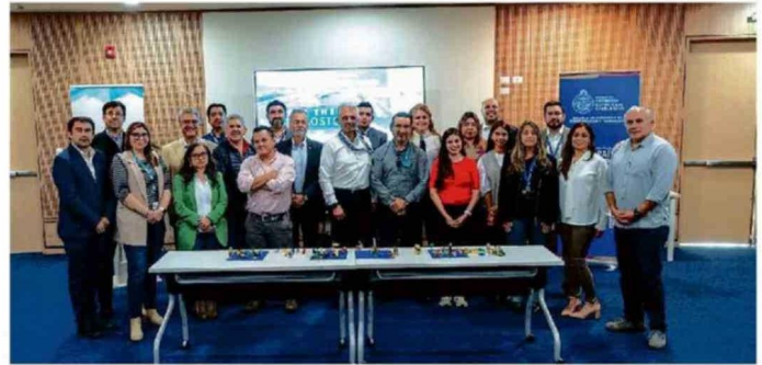
LOS PARTICIPANTES DEL TALLER REALIZADO EN EL EDIFICIO DE PUERTO SAN ANTONIO.

La ejecutiva agregó que "este taller busca levantar desafíos que formarán parte del Congreso que se realizará en San Antonio. Es clave incorporar miradas distintas, incluso de quienes no pertenecen directamente al sector portuario, porque enriquecen la discusión y potencian la creatividad para el desarrollo del territorio".