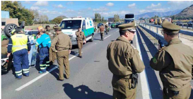
El jefe de Zona O'Higgins, llegó al lugar para verificar la situación.

del delito, esto en el sector sur de San Fernando. Es así como se activa el encargo del automóvil y se coordina un amplio operativo policial en la región, detectando el móvil en la