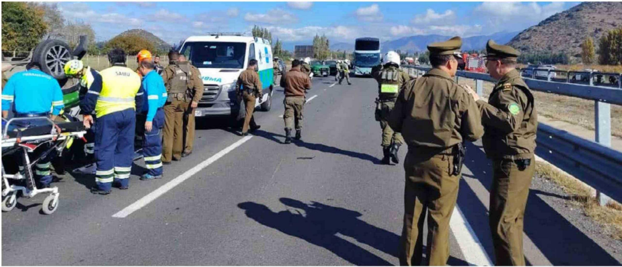
Se informó que la persecución se inició luego de un atraco cometido en San Fernando.

Título: Persecución policial termina con vehículo de carabineros volcado y cuatro antisociales detenidos