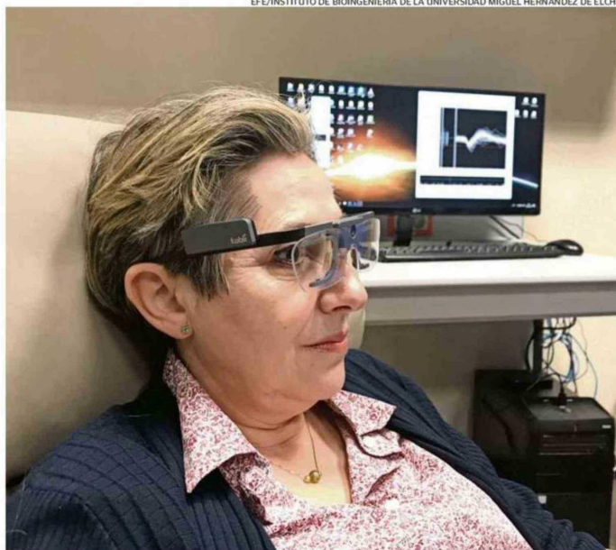
PACIENTE CIEGA, CON LENTES PARA SEGUIR SU MIRADA Y EL REGISTRO DE SU ACTIVIDAD CEREBRAL AL FONDO.

Son pasos necesarios hacia un futuro en el que "vamos a ser capaces de hacer muchas cosas que todavía hoy no son