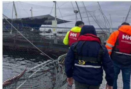
SERNAPESCA TOMÓ CONTACTO CON LA EMPRESA.

Dentro de las actuaciones realizadas, personal del Servicio Nacional de Pesca y Acuicultura (Sernapesca) se constituyó en el sitio del suceso con el objetivo de corroborar que todas las actividades que contempla el plan de acción estén siendo abor-