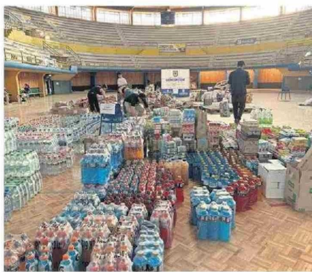
Concepción dispuso un centro de acopio en Gimnasio Municipal.

Desde el municipio también hicieron el llamado a todas aquellas personas, organizaciones e instituciones que estén levantando algún centro de acopio, que se contacten con el espacio destinado por la municipalidad en el Gimnasio Municipal para poder canalizar y gestionar la ayuda.