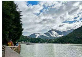
Caleta Tortel, visto desde el sur.