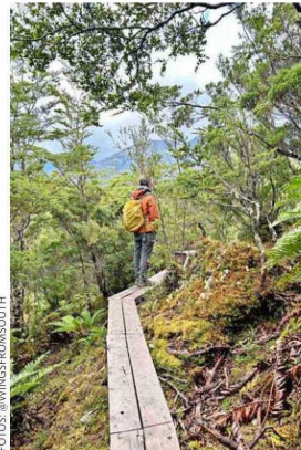
Sendero al cerro Vigía.

POR Gabriela Espejo , DESDE LA REGIÓN DE AYSÉN.