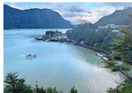
Desde el mirador El Faro.