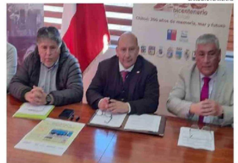
TEMA FUE REVISADO EN LANZAMIENTO DE DÍA DE PATRIMONIOS.

Otro de los temas que ha generado dudas es la implementación de los fondos de compensación por la cons-