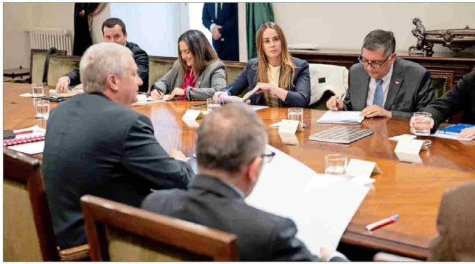
El Presidente Kast lideró el comité político ayer en La Moneda. Más tarde, se realizó la reunión "ampliada" con los partidos del oficialismo.