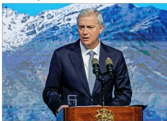
El Presidente expuso en el seminario Latam Focus, organizado por B7G Pactual.

Más tarde, en el Hotel W, el mandatario criticó fuertemente la reforma tributaria de Bachelet, a quien culpó del bajo crecimiento. En el equipo del Presidente destacaron que el relato tenga relación