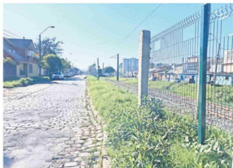
EN VICUÑA MACKENNA, ENTRE CAUPLICÁN Y ANÍBAL PINTO TERMINA LA REJA. HACIA EL NORESTE, NO HAY MÁS.