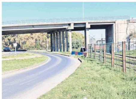
SEGÚN VECINOS, EN ESTA ZONA (MANUEL RODRÍGUEZ CON PADRE HURTADO) HABÍAN VALLAS FERROVIARIAS.