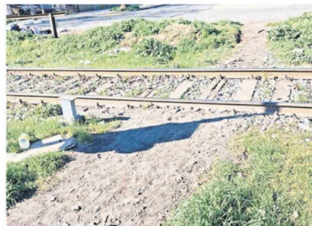
A TRAVÉS DE SENDERITOS COMO ÉSTE, DE CASTELLÓN CON VICUÑA MACKENNA, DEBEN ATRAVESAR LOS VECINOS DEL SECTOR.