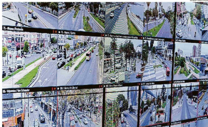
LOS "NUEVOS OJOS" DE LA CIUDAD JARDÍN ESTÁN DESIGNADOS EN LOS LLAMADOS PUNTOS ROJOS.

Desde el municipio señalaron que la distribución de las cámaras responde a un trabajo coordinado con las comunidades