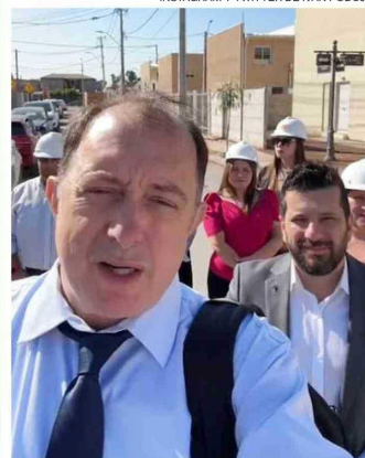
Poduje recorriendo un edificio parado por Conaf en Viña, mostrando un sitio fiscal eriazo en El Bosque, y con un alcalde PS y dirigentes en Padre Hurtado.