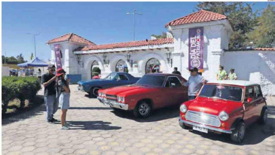
CALAMA Y LAS DEMÁS DE LAS COMUNAS DE LA REGIÓN TIENE PROGRAMADA UNA EXTENSA AGENDA DE ACTIVIDADES PARA CELEBRAR ESTE DÍA.

En la provincia, las jornadas estarán marcadas por iniciativas orientadas a relevar el patrimonio vivo, las tradiciones ancestrales y la memoria local, convocando tanto a residentes como visitantes a participar de actividades gratuitas y abiertas a toda la comunidad.