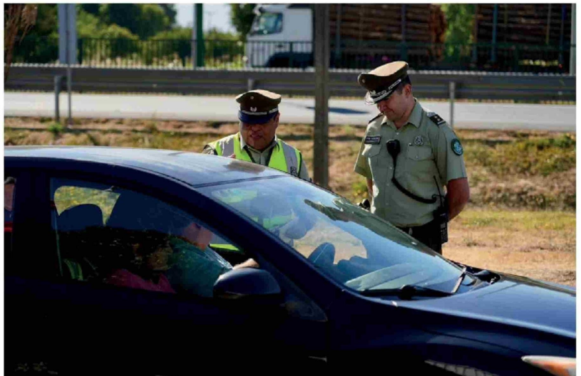
UN JOVEN DE 18 AÑOS FUE DETENIDO por homicidio frustrado contra carabinero en servicio, conducción temeraria e incumplimiento del toque de queda en Nacimiento.

La autoridad enfatizó además que las policías y las Fuerzas Armadas se encuentran desplegadas en todo el territorio regional para resguardar la seguridad de la población, especialmente en el actual escenario de emer-