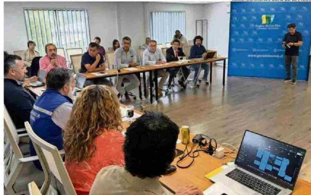
EL GOBERNADOR REGIONAL ADELANTÓ QUE ESTE TIPO DE ENCUENTROS SEGUIRÁN REALIZÁNDOSE EN LA ZONA.

Como resultado de esta reunión, se alcanzaron importantes acuerdos de trabajo que los destacan: La implementación de reuniones periódicas entre el Gobierno Regional y los alcaldes y alcaldesas, una metodología de trabajo comúnmente definida; el inicio de un financiamiento es-