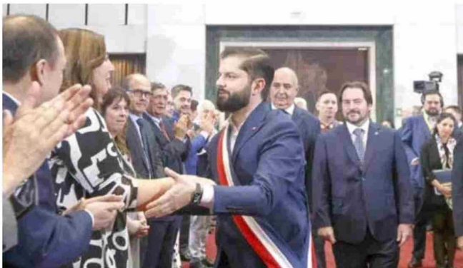
La senadora Paulina Vodanovic, valoró los anuncios del jefe de Estado en su cuenta pública.

Tiraje: 4.200 Lectoría: 12.600 Favorabilidad: No Definida