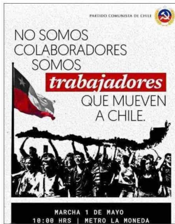
El PC ha difundido mensajes para sumarse a las manifestaciones.

“Es necesario que se exprese la agonía, dolor y sufrimiento que significa llegar a fin de mes y que se represente de manera unitaria”.