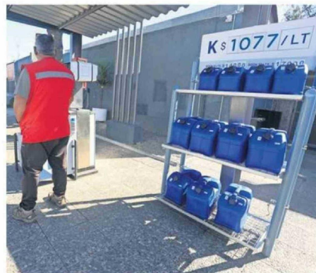
LOS POCOS QUE TIENEN ESTUFA SUFREN CON COMPRAR PARAFINA.

“El único problema es que esto te da otro gasto en medio de un momento económico complicado. El gasto en calefacción es importante, y a veces eso atrasa lo que es la construc-