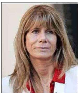
Ximena Rincón, ministra de Energía.