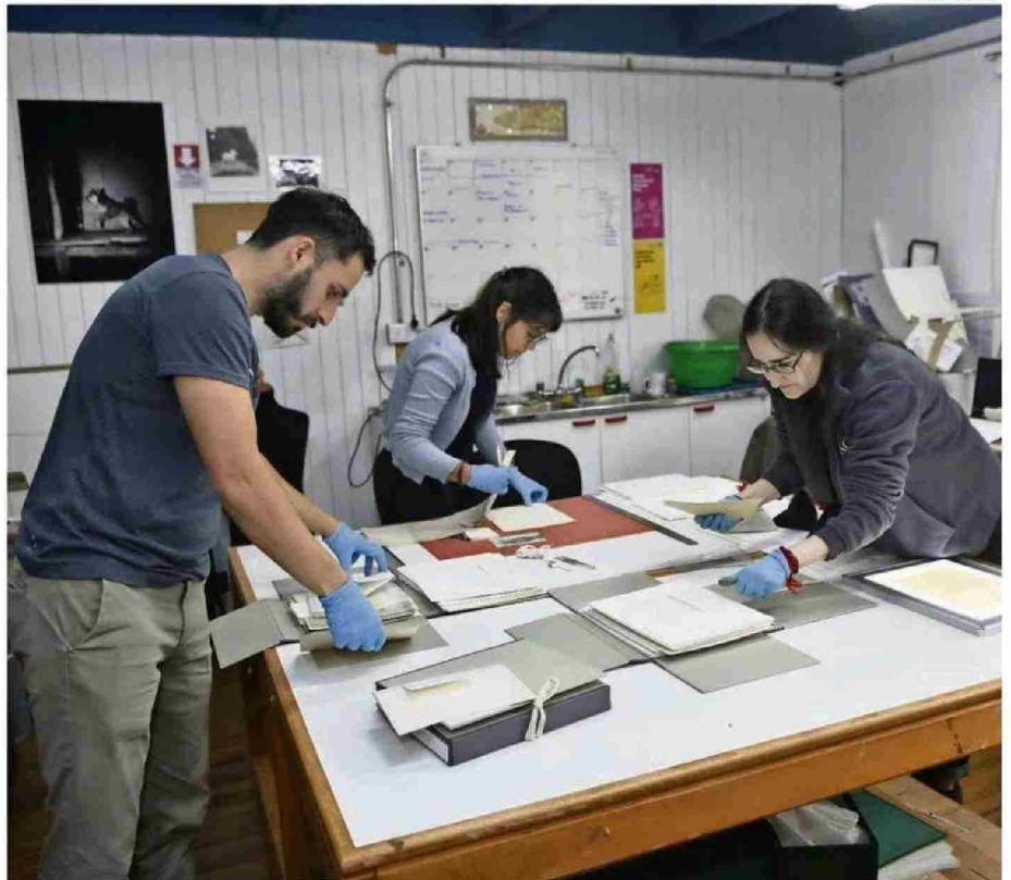
EL AÑO PASADO INICIÓ EL PROYECTO DE RESCATE DE LOS DOCUMENTOS, QUE EN LOS PRÓXIMOS MESES QUEDARÁN DISPONIBLES A ACCESO PÚBLICO.

“Tenemos prácticamente todo lo que circuló desde la década de 1860, hasta sus últimos meses de vida en 1904. Además, tenemos algunas cartas de una importancia no menor, que él le envió a su familia. El