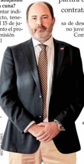
Tomás Rau, ministro del Trabajo.

— Vamos a presentar indicaciones al proyecto, tenemos plazo hasta el 15 de junio. En este momento el proyecto está en la comisión de Educación del Senado y estamos trabajando en hacerlo financieramente sostenible, especialmente por la estrechez fiscal que estamos teniendo. Este proyecto está en un momento en que enfrentamos una emergencia laboral, sobre todo en la tasa de desempleo femenino, que está en 10% a nivel nacional, y la ta-