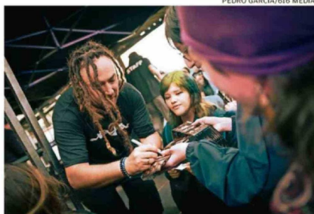
PEDRO GARCÍA/616 MEDIA.