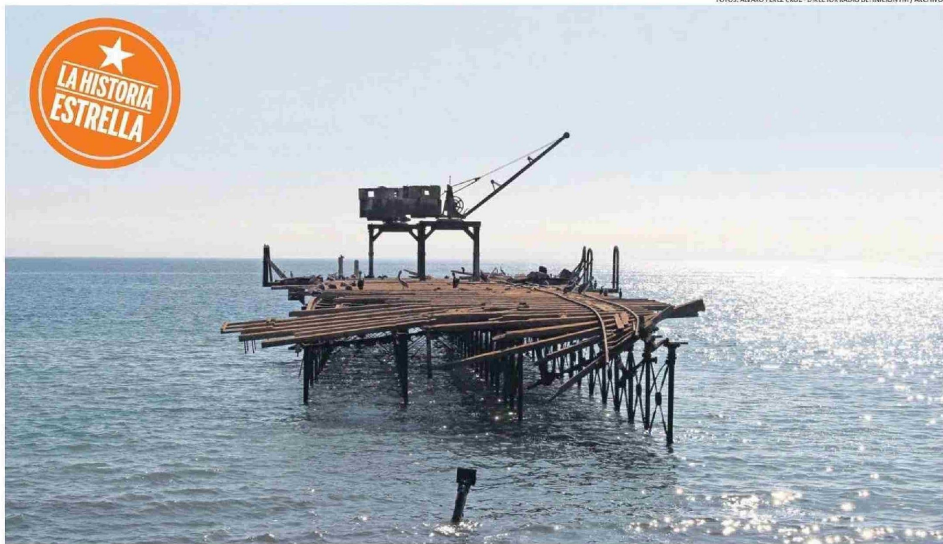
LOS RESTOS DEL ÚLTIMO DE LOS CUATRO MUELLES SALITREROS DE LA COMUNA, EL CUAL EN ENERO DE 2023 TERMINÓ CON DOS TERCIOS DE SU RAMPA DESTRUIDA TRAS UNA INTENSA MAREJADA.