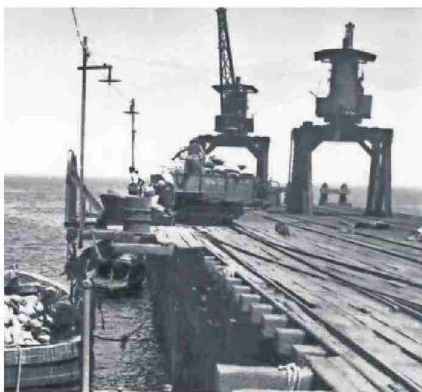
FUE ARMADO EN 1883 PARA EL EMBARQUE DE NITRATOS.