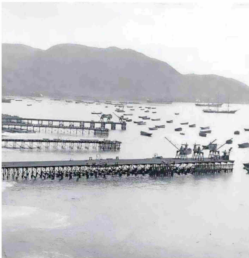
EL MUELLE ES EL ÚNICO DE CUATRO ORIGINALES QUE HUBO EN LA ÉPOCA SALITRERA (EL QUE QUEDA ES EL DE LA PRIMERA FILA).

en consideración la postura del Consejo de Monumentos Nacionales".