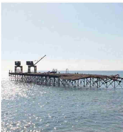
LAS DOS GRÚAS AÚN CONTINÚAN EN LA PLATAFORMA DE LO QUE QUEDA DEL EXEMBARCADERO.