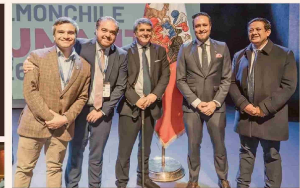
Marcelo Santana, gobernador regional de Aysén; Sergio Giacaman, gobernador regional del Biobío; Alejandro Santana, gobernador regional de Los Lagos; Rodrigo Wainrahtg, alcalde de Puerto Montt; y Marco Silva, alcalde de Calbuco.