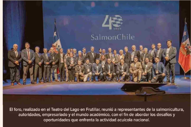
El foro, realizado en el Teatro del Lago en Frutillar, reunió a representantes de la salmonicultura, autoridades, empresariado y el mundo académico, con el fin de abordar los desafíos y oportunidades que enfrenta la actividad acuícola nacional.

Con un atractivo programa que permitió una conversación de gran nivel entre altos ejecutivos de empresas emblemáticas del país, autoridades de gobierno y el Presidente de la República, José Antonio Kast, la tercera versión del SalmonChile Summit fue el espacio para debatir sobre el futuro de Chile y medidas concretas para potenciar este relevante sector productivo.