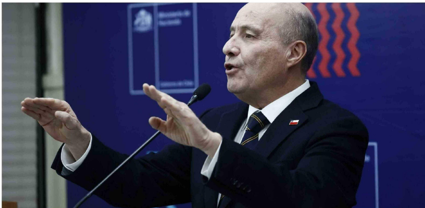
► Jorge Quiroz, ministro de Hacienda.