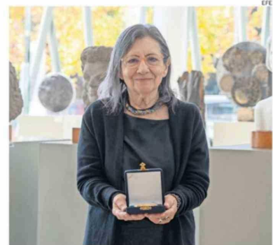
CARMEN OLLÉ NACIÓ EN LIMA EN 1947.

Su primer poemario, 'Noches de adrenalina', publicado en 1981, es una obra de referencia en la literatura latinoamericana. Esta obra pionera marca una inflexión en la poesía peruana mediante un lenguaje visceral que reflexiona sobre el cuerpo, el deseo, la escritura, el exilio, la ciudad como palimpsesto y las utopías de una generación.