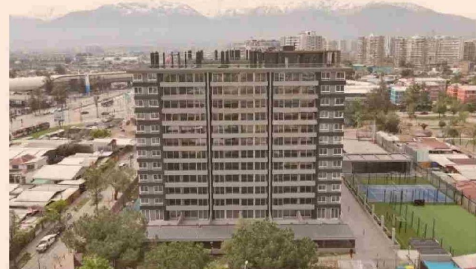
CAMPVS San Joaquín.

"Somos una alternativa viable para paliar el déficit habitacional, y un complemento que aporta a la ciudad, creando plusvalía y generando vida social en comunidad, de manera eficiente y segura", destaca el presidente del Directorio de ACTIVA .