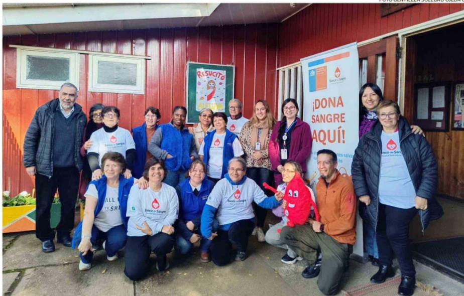
LOS VOLUNTARIOS DEL GRUPO SON INTEGRANTES DEL GRUPO DE MISIONEROS SEMBRADORES DE ESPERANZA DE LA PARROQUIA CRISTO REY DE VALDIVIA.