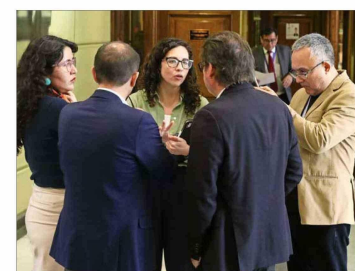
Los jefes de bancada del FA, PC y PS se reunieron ayer en el Congreso para abordar el ingreso de la propuesta.