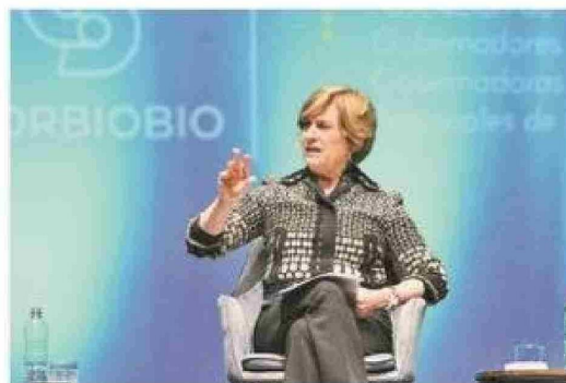
Evelyn Matthei, abanderada de Chile Vamos.

» El encuentro entre los candidatos presidenciales estuvo marcado por un crispado ambiente en el público, con pifias y aplausos y una fuerte pugna de Kast y Jara y los gestos de Matthei al centro