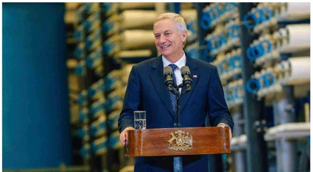
► El Presidente José Antonio Kast.

Sus palabras desataron críticas inmediatas desde la oposición, donde acusaron al gobierno de intentar justificar el recor-