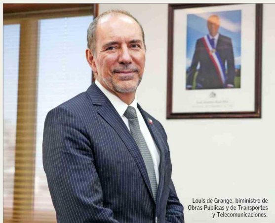
Louis de Grange, biministro de Obras Públicas y de Transportes y Telecomunicaciones.

La unificación de ambas carteras puede generar espacios para complementar decisiones de inversión en diversas áreas. Los peligros asociados a, por ejemplo, no poder abarcar las múltiples exigencias se podrían mitigar con equipos competentes y empoderados, especialmente los subsecretarios, indican los especialistas.