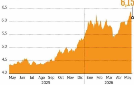
Cobre Dólares por Libra