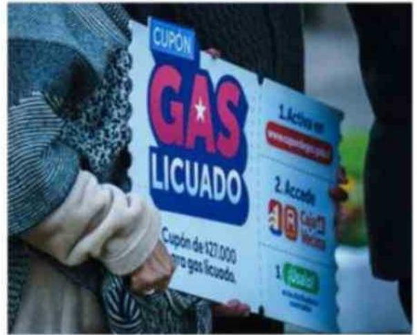
DIRIGIDO AL 80% DE HOGARES CON RSH.