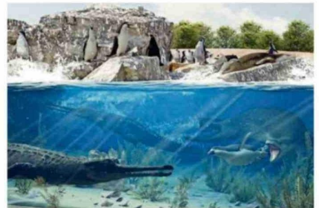
GAVIALES Y PEREZOSOS MARINOS VIVÍAN JUNTO A MEGALODONES.

ceno, hace unos 800.000 años. Esto se asemeja más a las aguas actuales de Perú.