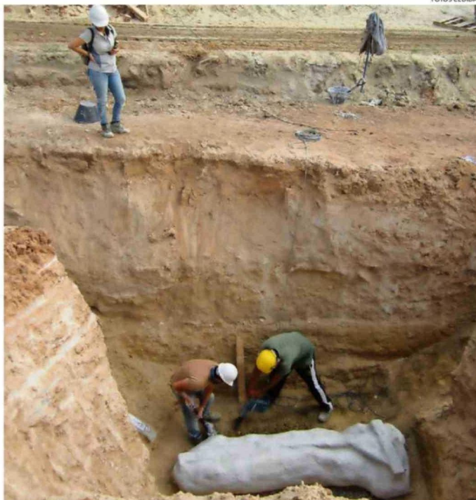
LA INVESTIGACIÓN USÓ ANTECEDENTES DE MONITOREOS A OBRAS EN COQUIMBO.