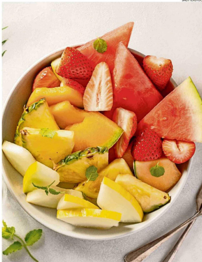
Una ensalada de frutas de verano puede ser una buena opción después de la piscina o la playa.

Estas mezclas "mejoran la absorción de carotenoides", sostuvo la docente, en referencia a aquella "sustancia amarilla, roja o naranja que se encuentra sobre todo en las plantas, como las zanahorias, verduras de hojas verde oscuro y muchas fru-