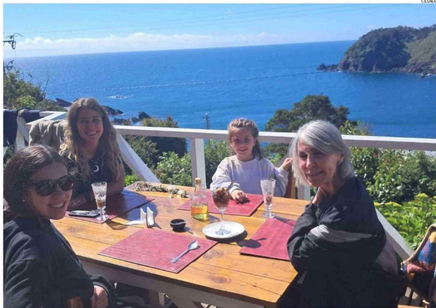
TURISTAS DISFRUTAN DE LA VISTA DEL OCEANO PACIFICO DESDE LAS TERRAZAS DE HOSTERÍA LA CASA DEL MAR, UBICADA EN BAHÍA MANSA.