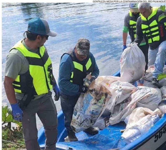
EN LA IMAGEN SE VE PARTE DE LAS ACCIONES CIUDADANAS POR DESCONTAMINAR EL RÍO PILMAIQUÉN.

DAÑO. Desde 1987 que el municipio de Puyehue es responsable del alcantarillado de Entre Lagos, cuyas aguas residuales son vertidas sin ningún tratamiento directo a ambos cuerpos de agua. Hay un proyecto desde 2011 para construir una planta de tratamiento, pero sin resultados, dado que ha enfrentado numerosas observaciones. La comunidad asegura que es un tema grave y sin respuesta de autoridades comunales y de la región.