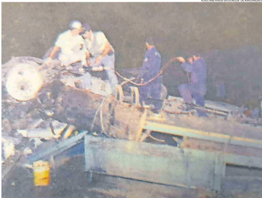
A LAS 21:40 HORAS EL CAMIÓN QUE INGRESABA DESDE CHUQUICAMATA PERDIÓ EL CONTROL MIENTRAS BAJABA POR LA AVENIDA.