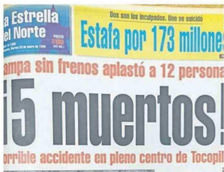
PORTADA DE LA ESTRELLA ANUNCIANDO LA ACIAGA NOTICIA.

En enero de 1996, un camión sin frenos arrolló a un grupo de jóvenes aliancistas en la comuna de Tocopilla, dejando 5 víctimas fatales. Hasta hoy el puerto recuerda el aciago hecho.