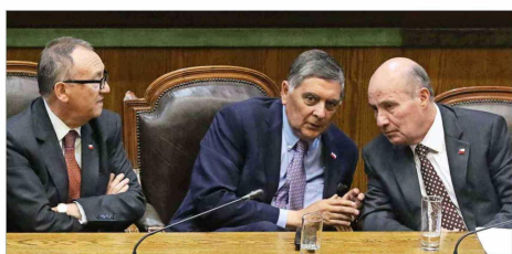
Los ministros José García (Segpres) y Claudio Alvarado (Interior) apoyaron al titular de Hacienda, Jorge Quiroz, en la discusión del plan de ayudas en el Congreso.

Como parte del trabajo prelegislativo del plan de reconstrucción, los ministros de Interior, Segpres y Hacienda ya se reunieron con los presidentes de los partidos oficialistas.