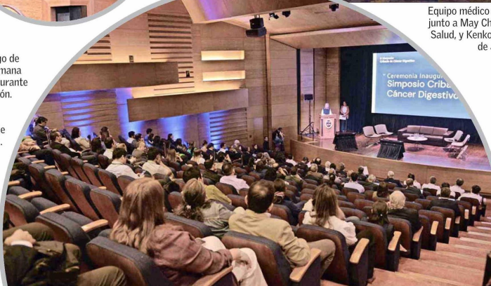
Ceremonia de inauguración.