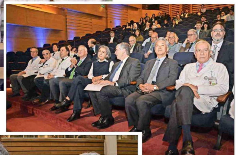
Autoridades y asistentes durante la inauguración del simposio.