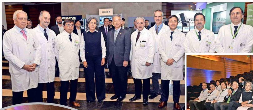
Equipo médico de Clínica UAndes junto a May Chomali, ministra de Salud, y Kenko Sone, embajador de Japón.