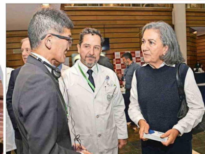
Durante el encuentro los asistentes pudieron realizar un recorrido por los distintos stands de laboratorios y sociedades.