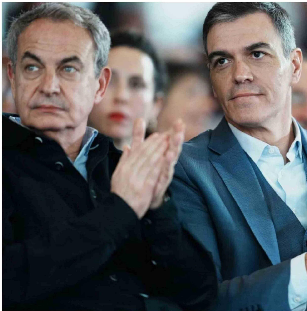
► El ex primer ministro español José Luis Rodríguez Zapatero junto al actual primer ministro Pedro Sánchez.

El exjefe del Ejecutivo socialista fue citado a declarar el próximo 2 de junio, acusado de organización criminal, tráfico de influencias y falsedad documental. “El tinglado se desmorona y los capos de la trama empiezan a caer”, proclamaron desde el opositor Partido Popular.