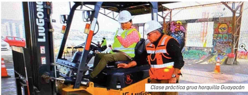
Clase práctica grúa horquilla Guayacán