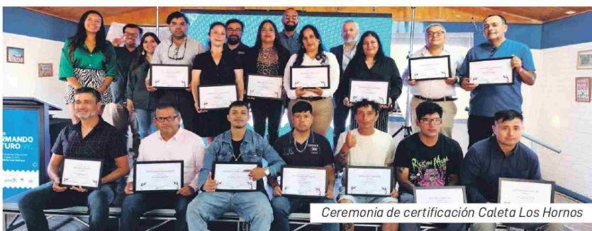
Ceremonia de certificación Caleta Los Hornos