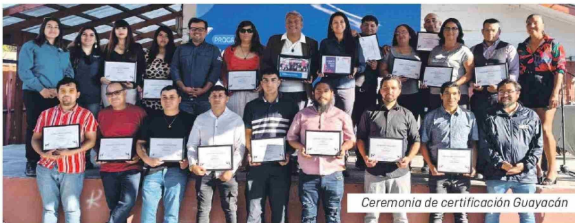
Ceremonia de certificación Guayacán