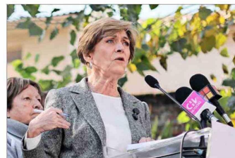
Evelyn Matthei (UDI) vio la Cuenta Pública en su casa y después encabezó una actividad con vecinos de Santiago.