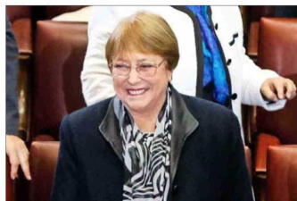
Michelle Bachelet fue la única exmandataria en asistir al discurso presidencial.

Matthei y Kaiser cuestionaron el discurso, mientras que en la izquierda, Jara valoró agenda laboral, pero dijo que en seguridad la situación sigue siendo “preocupante”, y Mulet criticó el escaso avance en descentralización, economía y, además, el proyecto de aborto. La exministra Tohá, en tanto, no opinó sobre el mensaje, pese a que participó en el Gobierno. Tampoco lo hizo Kast.