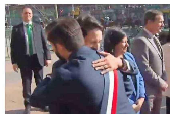
Gonzalo Winter (FA), de los colaboradores más cercanos al Presidente Boric, asistió a la ceremonia por ser diputado.