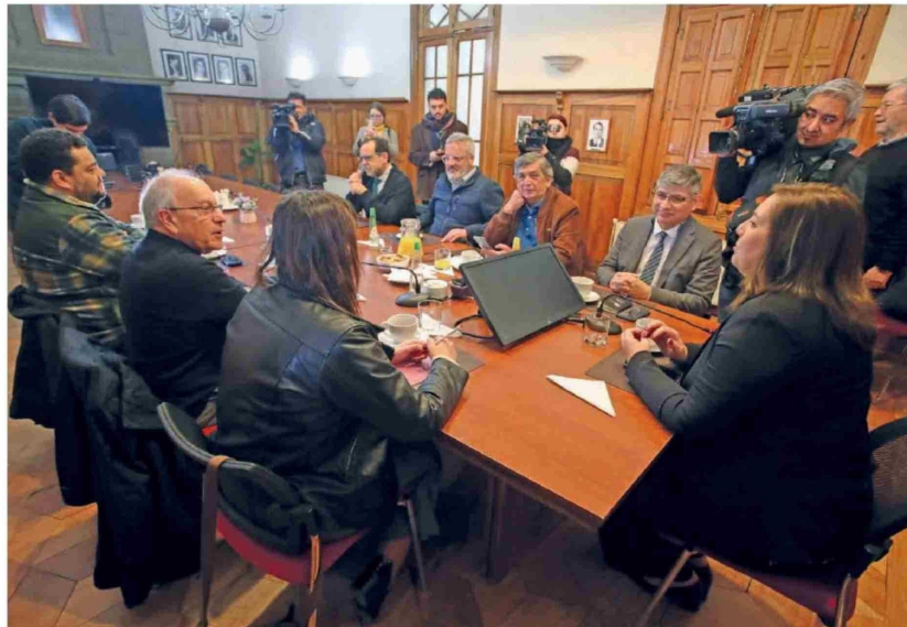
► Las negociaciones se han realizado en la sede del PS.