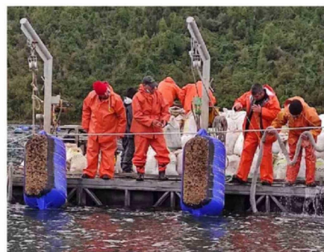
CHILOÉ CONCENTRA EL RUBRO MITILICULTOR TANTO EN LA REGIÓN COMO EL PAÍS.