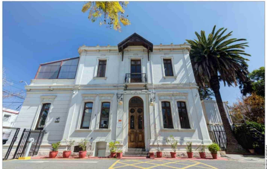
Espaciosa y monumental: 796 metros cuadrados, 16 dormitorios y 6 baños.

El ingeniero cuenta que el destino de la vivienda está más marcado por las restricciones normativas que por las historias de fantasmas.