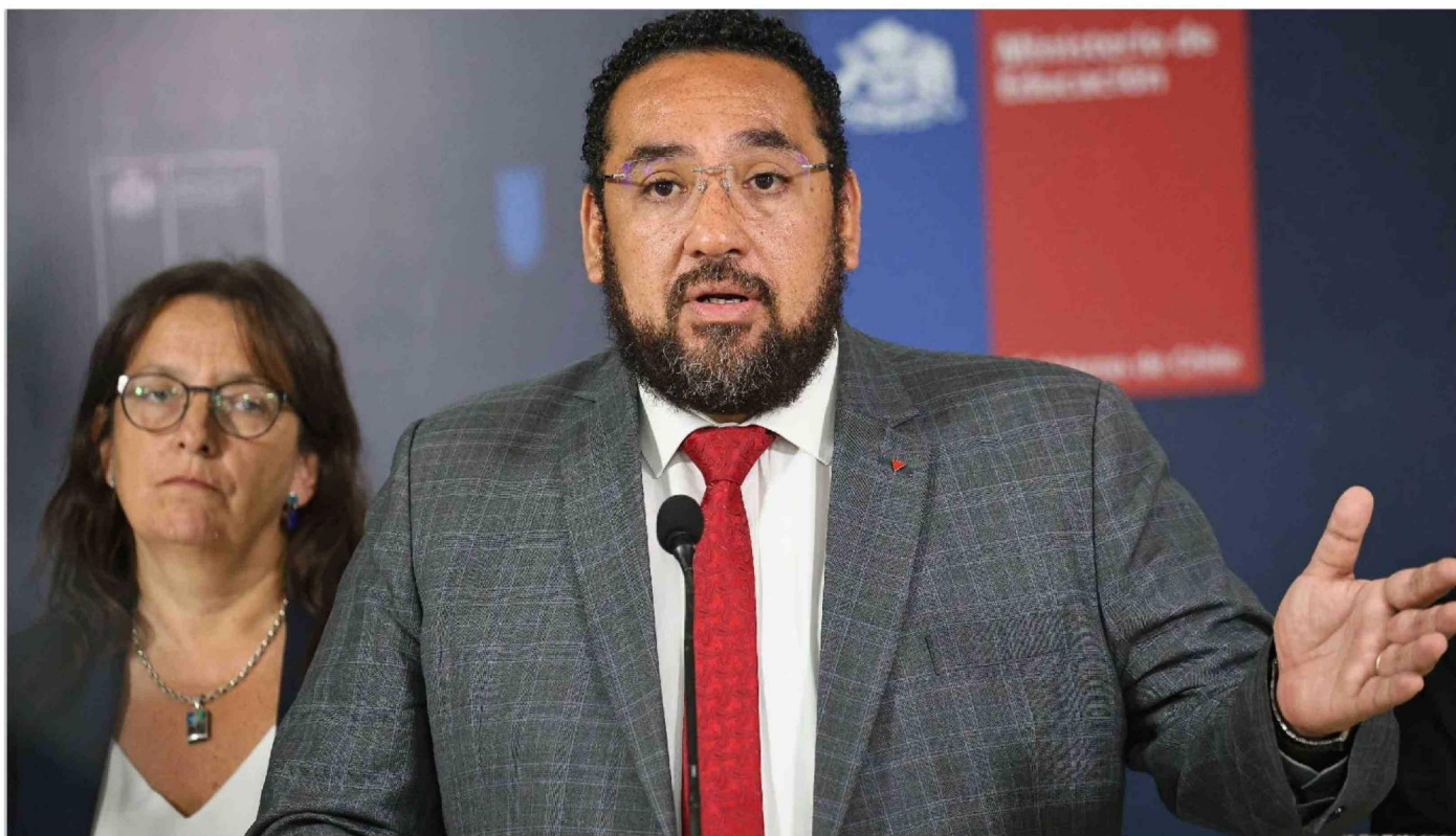
► El proyecto del FES se mantiene en la Comisión de Educación del Senado sin siquiera haber sido votado en general.