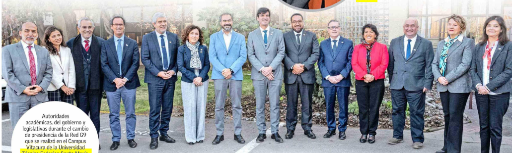
Autoridades académicas, del gobierno y legislativas durante el cambio de presidencia de la Red G9 que se realizó en el Campus Vitacura de la Universidad Técnica Federico Santa María.