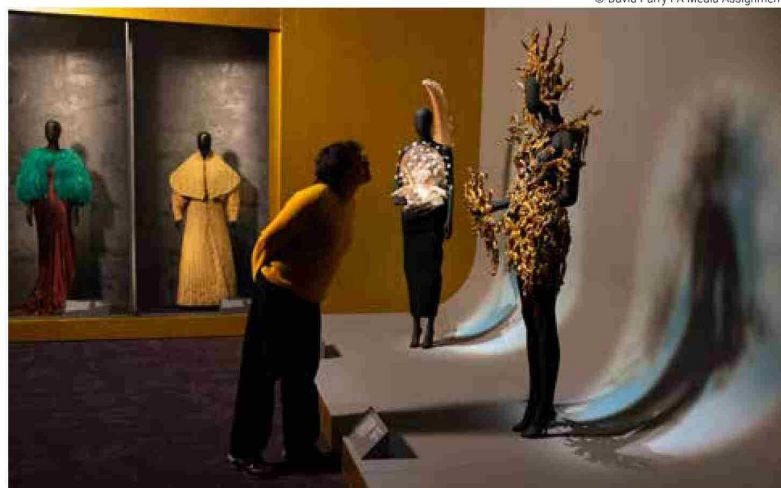
Schiaparelli: la moda se convierte en arte en el V&A South Kensington.